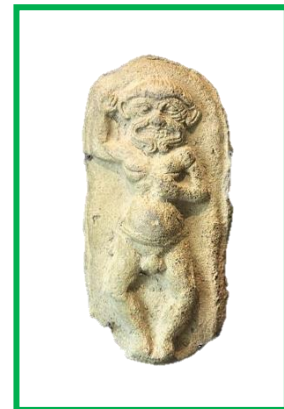
Humbaba terracottabeeld uit het Louvre

Er kunnen twee voorlopers van milieubewustzijn onderscheiden worden. Aan de ene kant kunnen we kijken naar botanisch onderzoek waarbij afhankelijk van de auteur en de tijdperiode, er aandacht werd besteed aan het milieu waarin de plant zich bevond. We zullen echter moeten wachten tot de 18e eeuw voordat de vraag wordt gesteld wat de rol van de plant is binnen het milieu. Binnen het domein van het botanisch onderzoek zien we doorheen de tijd verschillende veranderingen. Aan de andere kant bestaan er al sinds het begin van de geschiedschrijving conservatietechnieken. De eerste geschreven bron die verwijst naar de conservatie van bossen is het Gilgamesh epos. Dit epos werd geschreven rond 2100 voor Christus en vertelt het verhaal van de legendarische koning