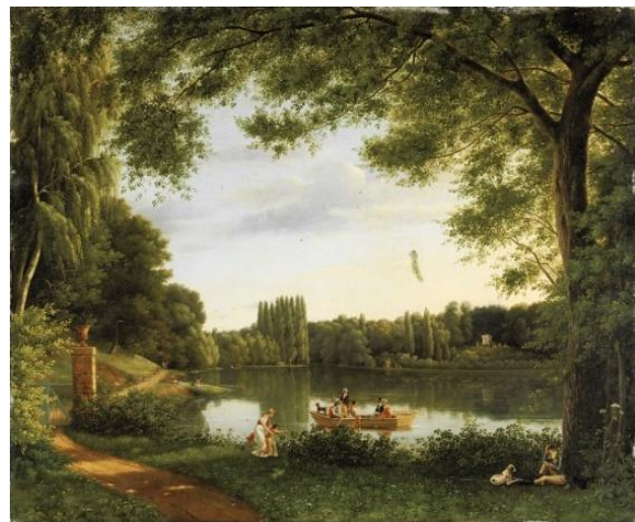
Vue du Lac d'Ermenonville Door: Jean-Joseph-Xavier Bidauld

Hoofdzakelijk na 1760 probeerde enkele aanhangers van Rousseau, zijn ideeën in praktijk om te zetten. Volgens Richard H. Grove zou het eiland Mauritius de bakermat zijn van de praktische toepassing van het milieubewustzijn. Het eiland kwam in 1716 in bezit van de Fransen. 27 Op het eiland werden er verschillende initiatieven genomen om de natuur te beschermen. Er ontbrak echter continuïteit doordat de initiatieven door verschillende individuen werden getrokken. Wanneer deze werden overgeplaatst of er nieuwe personen aan de macht kwamen, werden de initiatieven stopgezet of aangepast afhankelijk van de belangen van de nieuwkomers. Pierre Poivre die sinds 1767 de gouverneur van Mauritius was, was net zoals Rousseau een fysiocraat. Terwijl hij gouverneur was hechtte hij veel belang aan het beheer van de lokale bossen. In 1763 en 1764 gaf Pierre Poivre, een speech over de negatieve effecten van ontbossing aan de landbouwverenigingen in Lyon waarbij hij hen er op wees dat ontbossing tot grote droogte kan leiden die op haar beurt